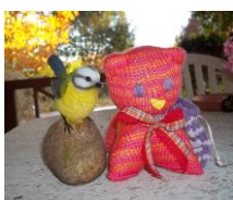
Chats en laine