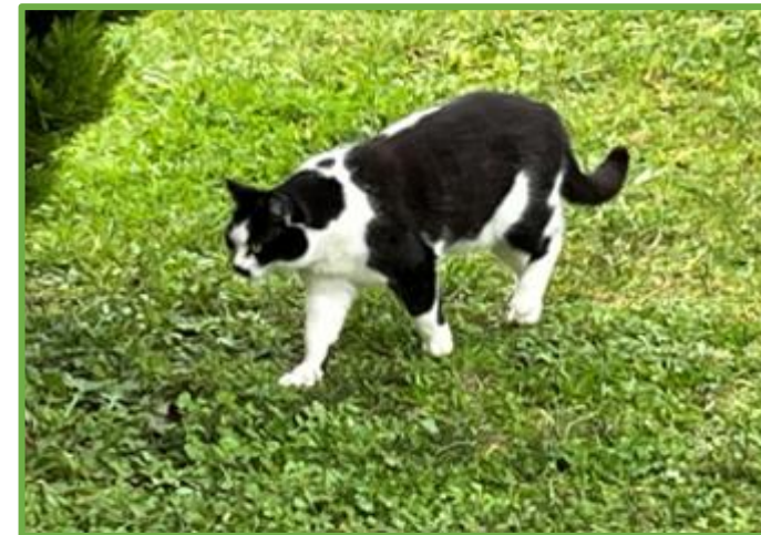
2 des occupants des lieux 🐱